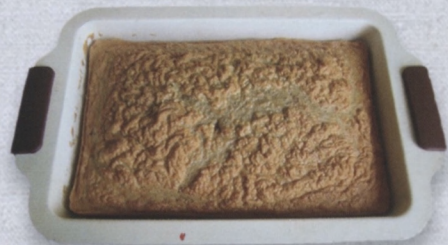
Икряник – Блюдо из рыбной икры