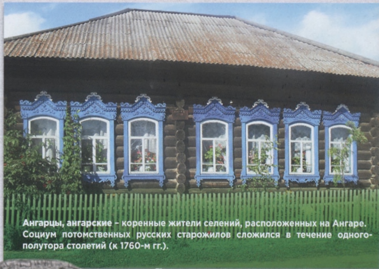
Ангарцы, ангарские – коренные жители селений, расположенных на Ангаре. Социум потомственных русских старожилов сложился в течение одного-полутора столетий (к 1760-м гг.).