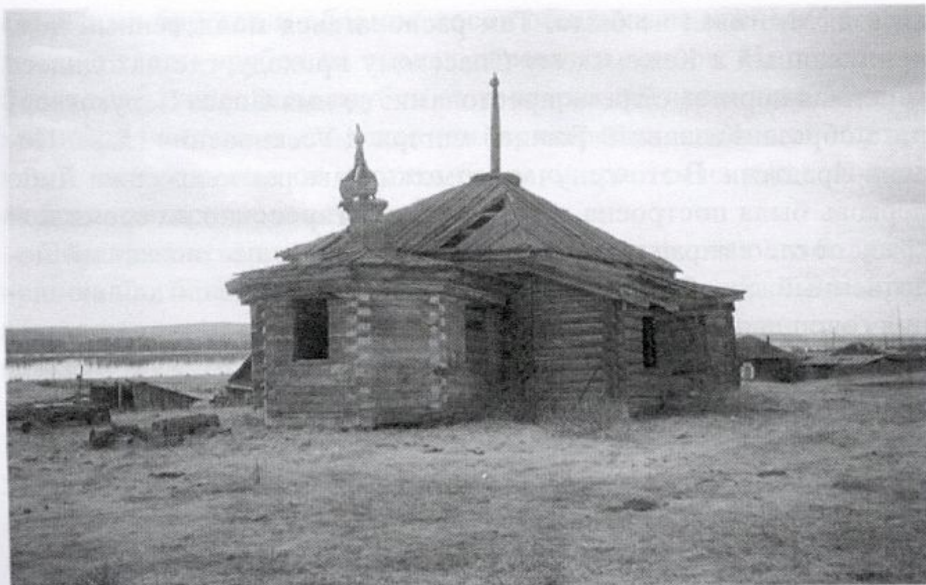
Рис. 1. Церковь из д. Мозговой Кежемского района Красноярского края