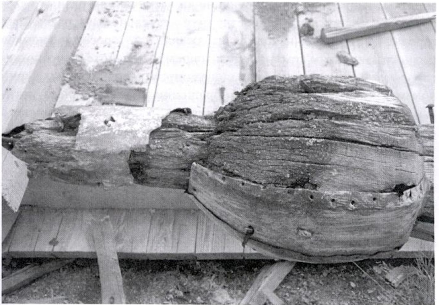
Рис. 3. Фрагмент главки церкви из д. Мозговой Кежемского района Красноярского края. 2011 г.